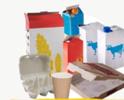
EMBALLAGES CARTONS & BRIQUES ALIMENTAIRES