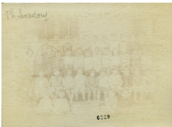
© « Famille nombreuse » - ISABELLE LEVADOUX

l'imagination et la créativité des habitants, pour que, collectivement, ils réinventent leur patrimoine !