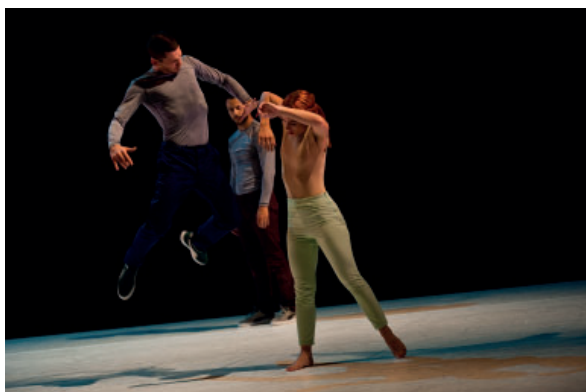
© « L'IniZio » - JP MARCON