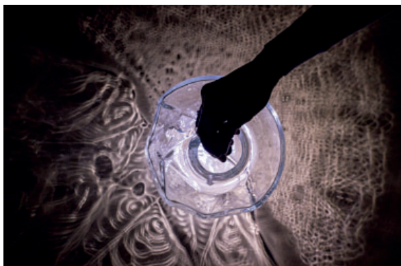
© « Paysage emprunté » - ISABELLE LEVADOUX