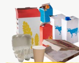
EMBALLAGES CARTONS & BRIQUES ALIMENTAIRES