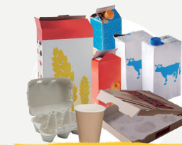
EMBALLAGES CARTONS & BRIQUES ALIMENTAIRES

AUJOURD'HUI, 100 % DES EMBALLAGES SE TRIENT