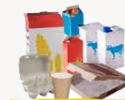
EMBALLAGES CARTONS & BRIQUES ALIMENTAIRES

AUJOURD'HUI, 100 % DES EMBALLAGES SE TRIENT