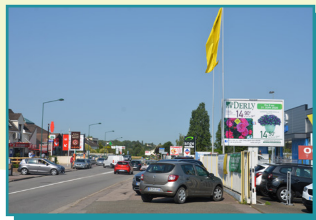
Publicités, préenseignes, enseignes : le RLPI doit permettre d'organiser et d'harmoniser la présence publicitaire sur tout le territoire.