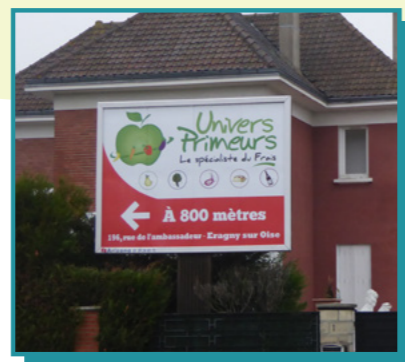
Une préenseigne indique la proximité d'une activité par une flèche, une direction

La concertation ouverte jusqu'au 19 décembre 2021 a permis de consulter la population, les fédérations ou unions de professionnels de la publicité et des enseignes, les sociétés d'affichage, les commerçants... Deux réunions publiques ouvertes à tous et quatre sessions plus spécifiques ont complété le dispositif d'information et d'expression mis en œuvre (site internet dédié rlpi.gpseo.fr , lettres d'information...)