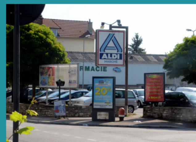
Les règles du RLPi s'appliqueront sur tout le territoire après l'approbation du document prévue en mars 2023

Éventuellement amendé, le dossier est soumis au vote du Conseil communautaire pour approbation. Une fois validé, le RLPi entre en vigueur un mois plus tard dans les 73 communes de GPS&O, après que toutes les obligations d'information ont été mises en œuvre (affichage, annonce légale...).