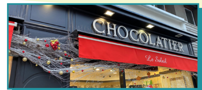
Les enseignes des magasins peuvent être apposées sur la façade, un store, un totem...

Le dossier d'enquête sera consultable dans les lieux d'enquête désignés et sur elaboration-rlpi-gpseo.enquetepublique.net .