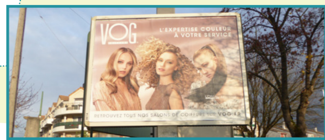
La publicité est destinée à informer ou à attirer l'attention du public