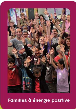
Familles à énergie positive