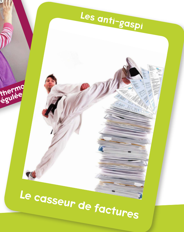
Le casseur de factures

Familles à énergie positive engagées pour le climat !