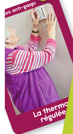
La thermo régulée