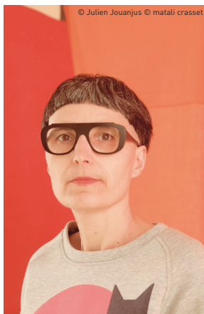
© Julien Jouanus © matali crasset