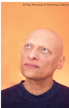
© Paul Rousteau © Dominique Dalcan

Dominique Dalcan est un musicien français. Compositeur et chanteur, il a été l'un des précurseurs de la nouvelle pop musique française dans les années 1990 en mélangeant l'électronique et l'acoustique. Il a collaboré avec des artistes de la chanson française (Camille, Zazie...) et de musique électronique (Autechre, Ryuichi Sakamoto...). Il est lauréat des Victoires de la musique 2018 en catégorie Album de musiques électroniques pour son dernier album Temperance .