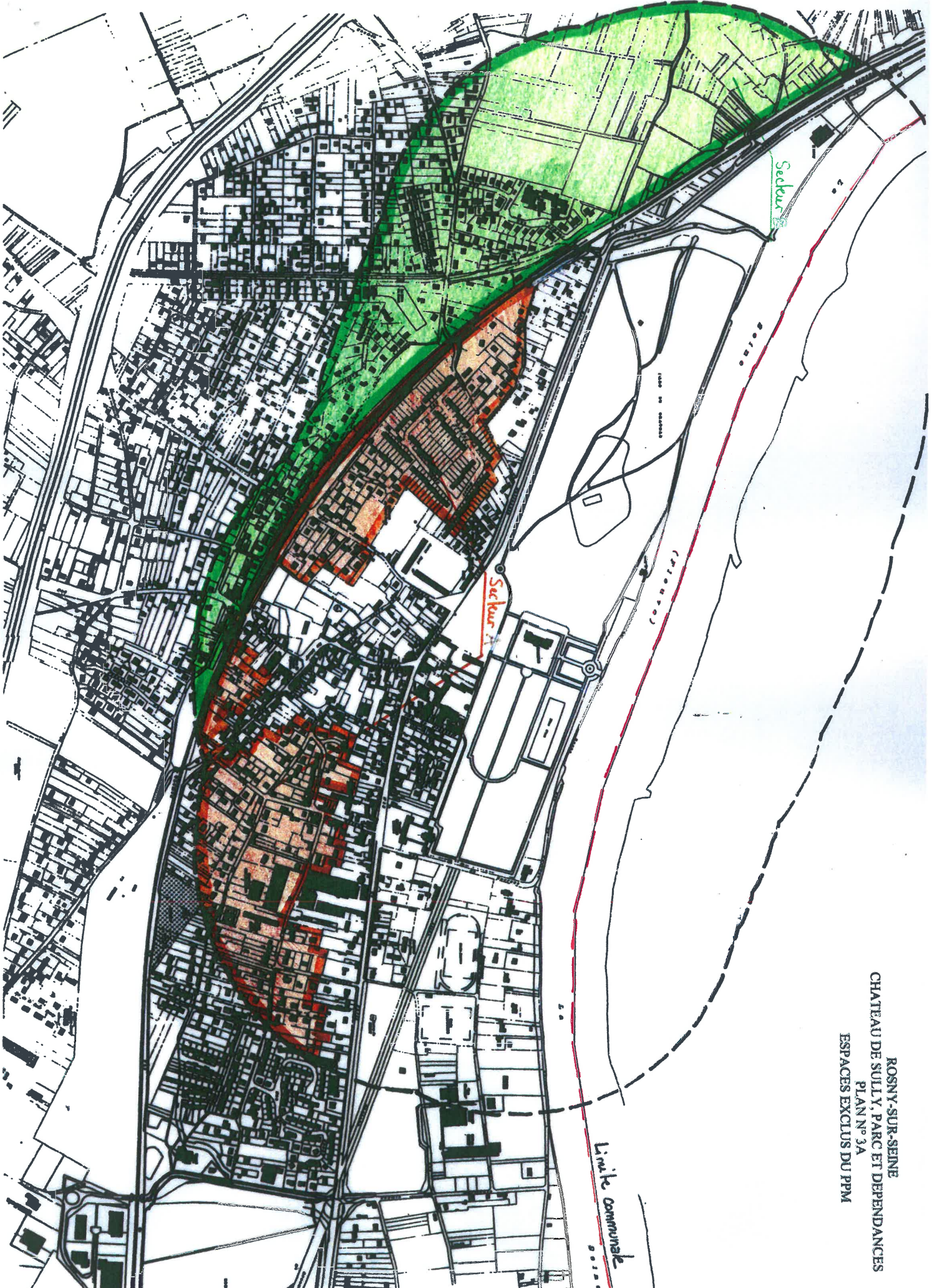
ROSNY-SUR-SEINE CHATEAU DE SULLY, PARC ET DEPENDANCES PLAN N° 3A ESPACES EXCLUS DU PPM