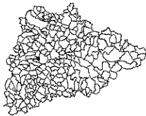
Tableau récapitulatif des communes des Yvelines