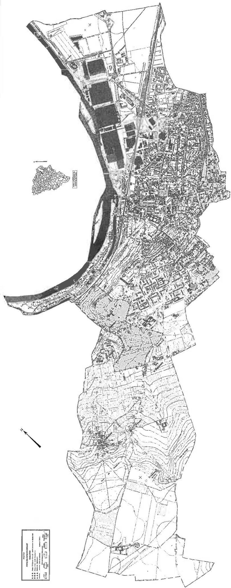
Etat de l'inspection générale des carrières en 2015 Départements des Yvelines, du Val de Seine et de l'Essonne