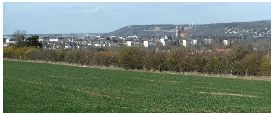
Paysage « ville-nature », source : GPS&O

C'est donc cette association « ville-nature » qui marque profondément le territoire.