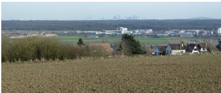
Paysage « ville-nature »

Le territoire se présente donc comme un axe sur lequel des agglomérations structurantes de taille comparable s'égrènent. Ce système urbain multipolaire est structuré autour des pôles de Mantes et de Poissy (pôles urbains majeurs), des Mureaux (pôle majeur mais excentré et de rayonnement limité, du fait de cette position géographique mais également de la présence/concurrence d'autres pôles à proximité), et d'Aubergenville (pôle interstitiel plus modeste).