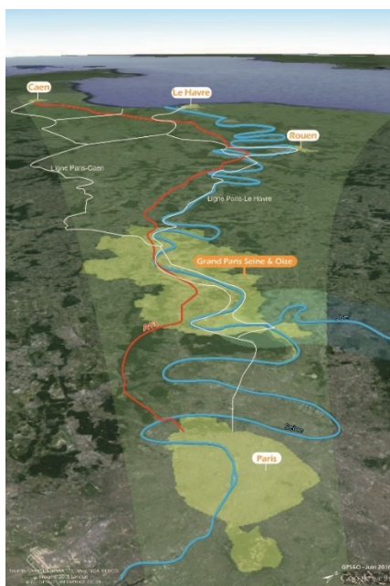
Positionnement stratégique de GPS&O

GPS&O se situe dans la grande couronne de la Région Ile-de-France et au nord des Yvelines. C'est un territoire « métropolisé » dont la ville centre de référence (Paris) ne se situe pas sur son territoire, mais à l'extérieur.