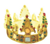
Collégiale de Poissy Lieu de naissance de saint Louis