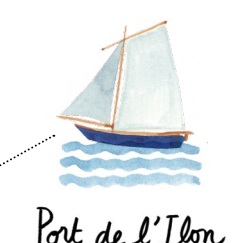
Port de l'Ibon

Vers Giverny et la Normandie Towards Giverny and Normandy La route des Gîtes vers la Roche-Guyon La route des Crêtes (Crest Road), heading towards La Roche-Guyon