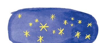
Parc aux étoiles