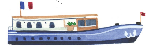
Capitale de la batellerie