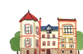
Maison de Zola