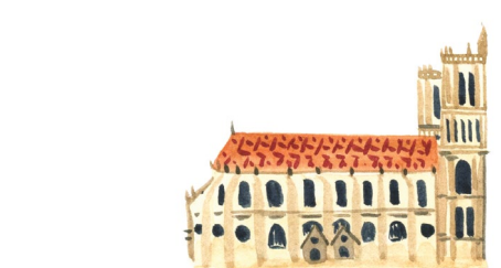
Collégiale de Mantes-la-Jolie