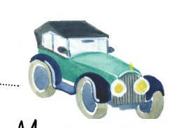
Musée de l'aventure automobile