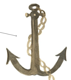
Musée de la batellerie et des voies navigables