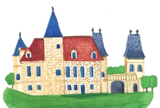
Château de Médan