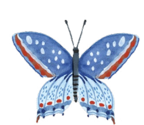
la Maison des Insectes