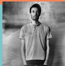
CHAPELIER FOU ENSEMBLE