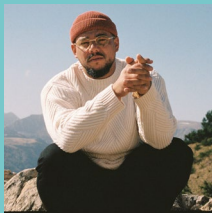
BEN L'ONCLE SOUL