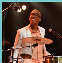
MANSFARROLL & CAMPANA PROJECT