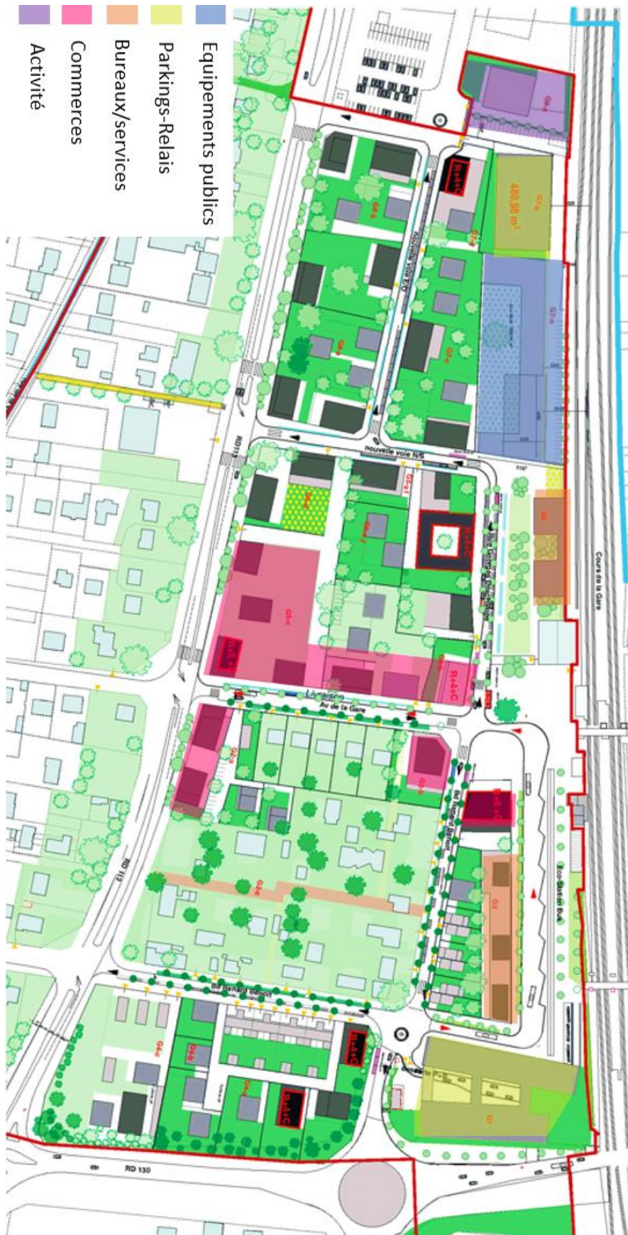
Projet urbain quartier de gare – Plan général des travaux