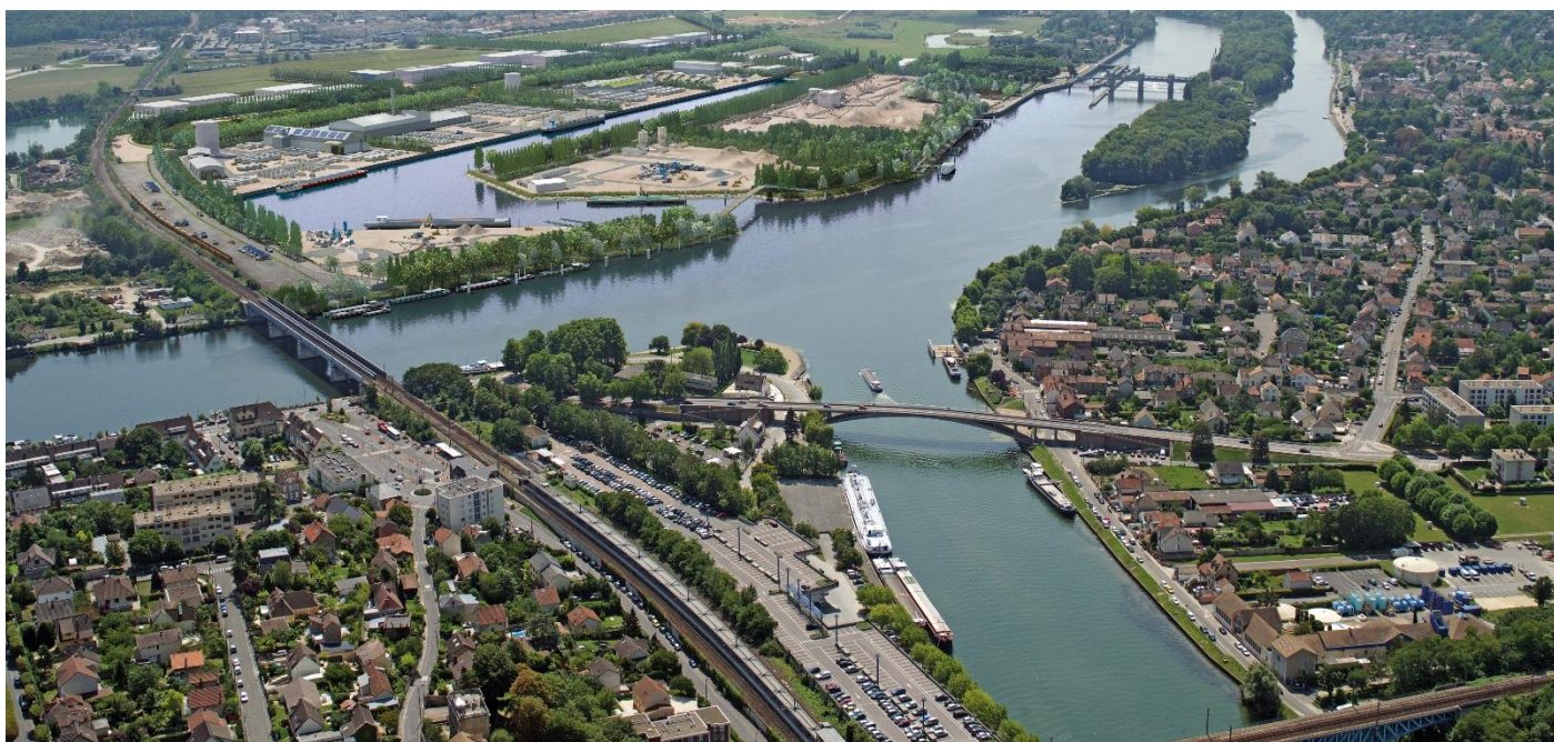
Confluence de l’Oise et de la Seine à Conflans-Sainte-Honorine, futur carrefour européen entre l’Axe Seine et le Canal Seine Nord