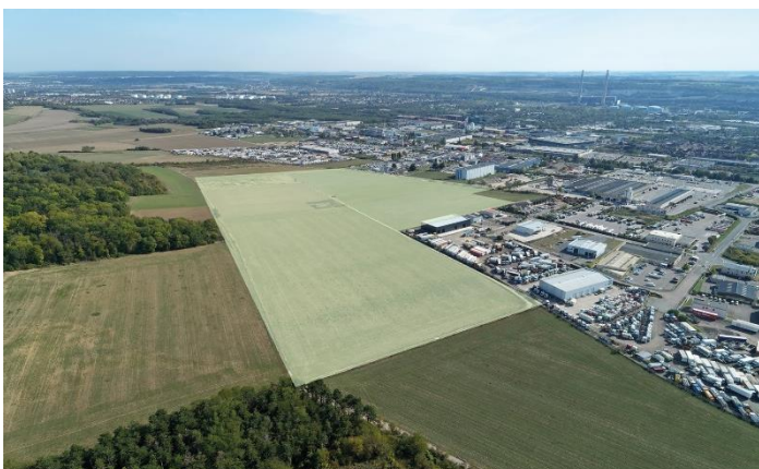
Vue aérienne des 15 ha de l'extension des Hauts-Reposoirs à Limay