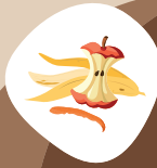
Fruits et légumes (épluchures, trognons) dont les agrumes