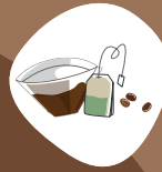
Marc de café, sachets de thé