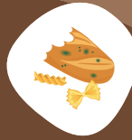
Restes alimentaires (dont pain)