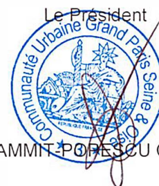
ZAMMIT POPESCU Cécile

POUR EXTRAIT CONFORME, Aubergenville, le 19 décembre 2024